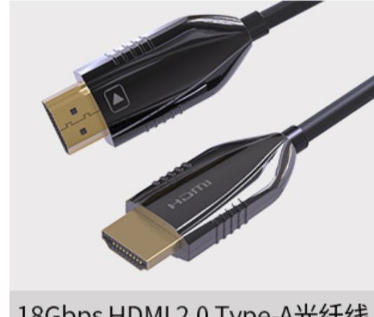
18Gbps HDMI 2.0 Type-A光纤线