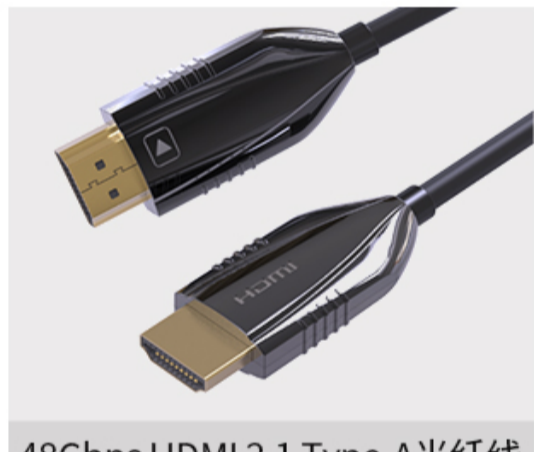
48Gbps HDMI 2.1 Type-A光纤线